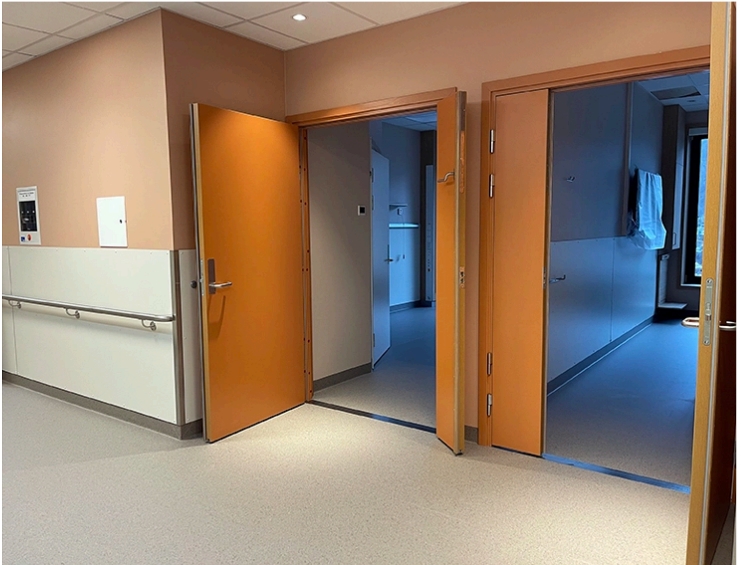
7. etasje Livabygget, etasjen til ortopedi og geriatri.

Milepelen blir markert tysdag 5. mars der Veidekke med sine arbeidarar og stab er invitert til kaffi og kake i varemottaket på Livabygget. Det er vel fortent, for Veidekke leverer på sine fristar.